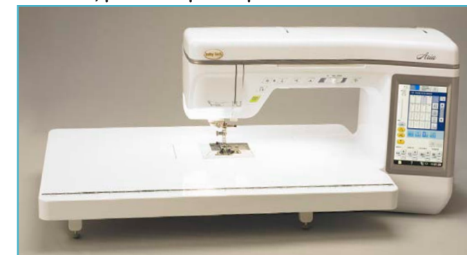
Table Extension pour Courtepointe

Offrez à vos mains plus de temps libres avec cette pédale Multi-Fonction. Démarrez et arrêtez la couture à l'aide de la pédale principale qui remplit deux fonctions pratiques avec l'appui du talon et le latéral de la pédale. Choisissez deux des quatre options: pour la coupe du fil, aiguille en haut/en bas, point unique ou point arrière.